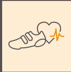
Gesundheitsmaßnahmen und Sportevents