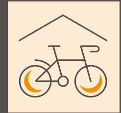
Fahrradkeller und Duschkabine

Weitere Benefits finden Sie unter: www.salzburgresearch.at/benefits