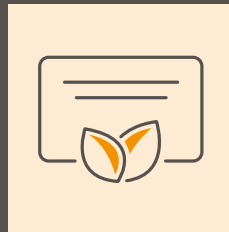
Klimaticket Salzburg oder Fahrtenpauschale