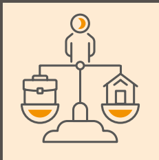
Gleitzeit und individuell flexible Arbeitszeitmodelle

Wir suchen eine Führungspersönlichkeit mit hoher fachlicher und wissenschaftlicher Qualifikation, sowie ausgezeichneten Kontakten zu Wirtschaftsunternehmen und anderen Forschungsinstitutionen. Sie besitzen sehr gute Kenntnisse der internationalen und nationalen Förderprogramme und haben bereits Erfahrung in der Umsetzung von wirtschafts- und industrienahen Projekten. Unternehmerisches Denken, betriebswirtschaftliches Know-how und Erfahrung in der Führung von Mitarbeiter:innengruppen runden Ihr Profil ab.